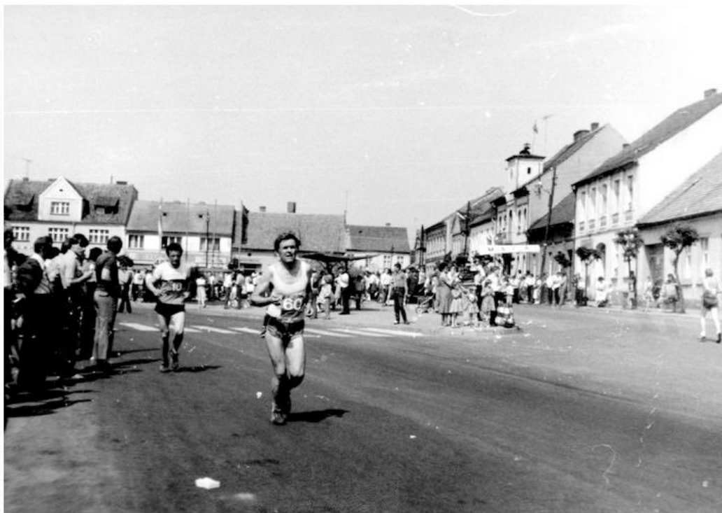
Fotka 2 z 4