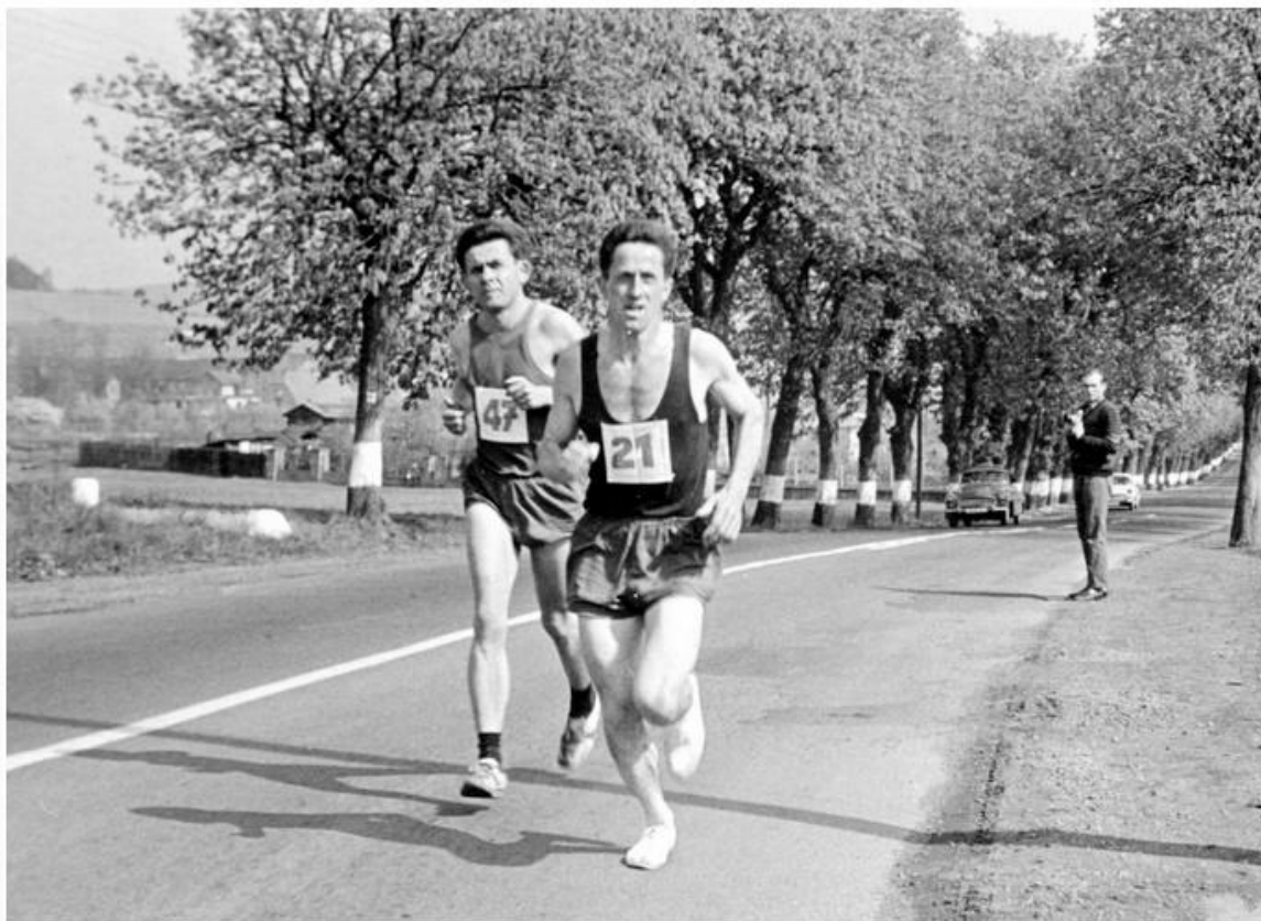
Fotka 2 z 4