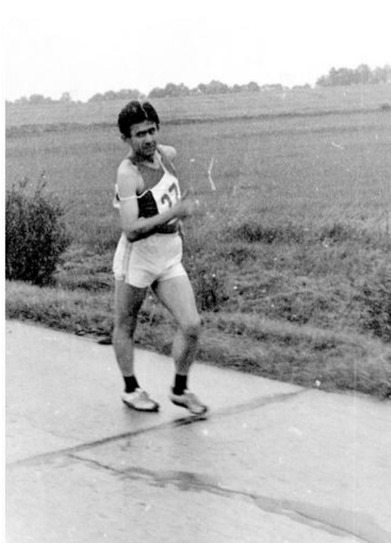
Fotka 1 z 4

Do projektu se zapojila i naše armáda a dodnes si myslím, že nebýt jednoho plukovníka generálního štábu, který uměl se Sověty jednat jako bývalý Svobodův voják, nikdy bychom se do Sovětského svazu nedostali. Oni o nás zas tak moc nestáli.