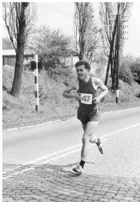
Fotka 3 z 4

Po slavnostním zahájení štafety na Staroměstském náměstí jsme běželi přes Kolín, Havlíčkův Brod, Brno a Přerov, dále přes Valašské Meziříčí a Rožnov do Žiliny, pak pod Tatrami přes Ružomberok, Poprad a Košice do Vyšného Nemeckého.