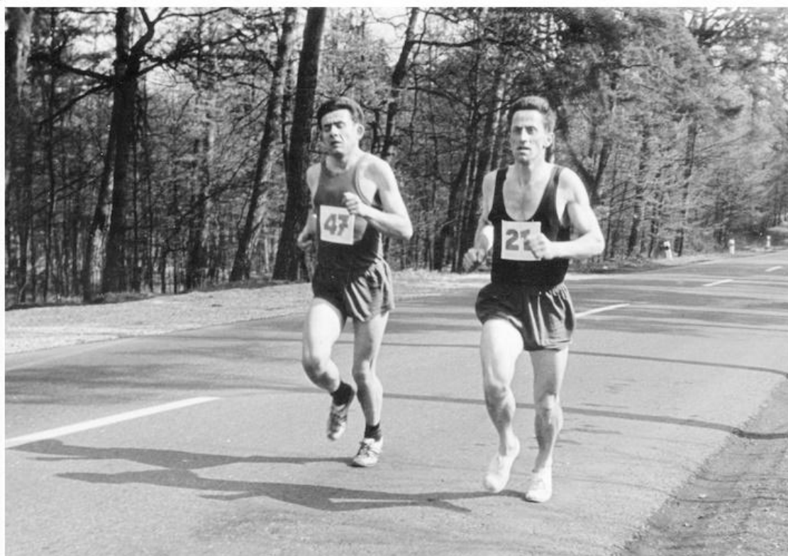
Fotka 4 z 4

Nejprve bych ale chtěl reagovat na dotaz jedné čtenářky, v jakých botách jsme vlastně tehdy chodili ty stokilometrové pochody. Inu v tom, co právě bylo na trhu a co český obuvnický průmysl vyrobil. Zatímco třeba polobotky z n. p. Svit se v té době běžně vyvážely do ciziny a tam šly docela na odbyt, znárodněný průmysl se příliš neobtěžoval, aby nějak reagoval na poptávku po nových typech obuvi pro volný čas. Pro n. p. SVIT v tehdejší Gottwaldově to byla moc malá ryba.