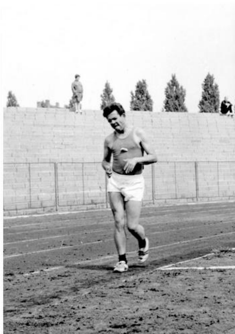
Fotka 3 z 4