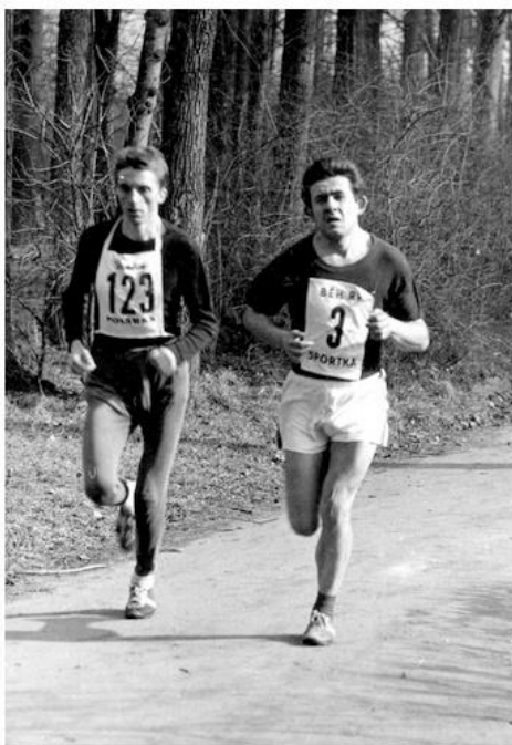
Fotka 4 z 4